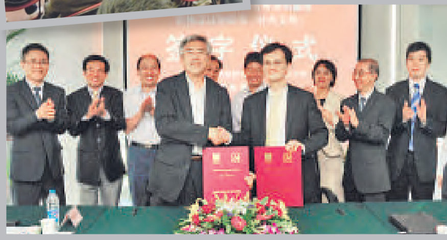
▲與內地協會進行訪問，以加強與內地業界之聯繫