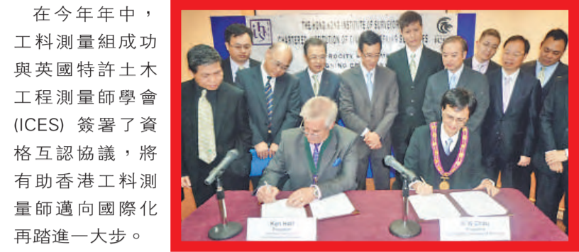
▲與英國特許土木工程測量師學會 (ICES) 簽署資格互認協議