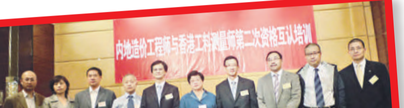
▲內地造價工程師與香港工料測量師第二次資格互認培訓