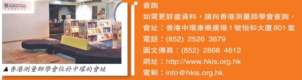
▲香港測量師學會位於中環的會址