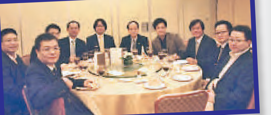
▲與內地協會進行訪問，以加強與內地業界之聯繫