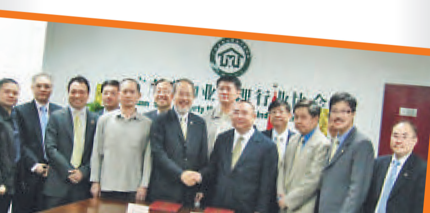
▲與內地協會進行訪問，以加強與內地業界之聯繫