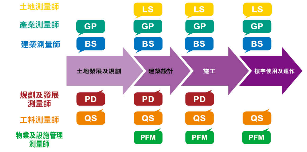
香港測量師學會六大專業組別的測量師於建築周期的各階段都有所貢獻。

測量師的工作涵蓋範圍十分廣闊，主要可以分為建築測量、產業測量、土地測量、規劃及發展、物業設施管理、工料測量六種。林力山博士測量師以保育舊建築為例：「我們的工作雖然並非甚麼轟動的大事，但卻是對社會有無限貢獻，比如保育工作，當中牽涉到很多不同環節，並不單純是防止它倒塌如此簡單。例如建築測量師會先測它的結構，然後專業測量師考慮如何將保育後的建築物活化定位，為物業資產增值，再到後期則需要物業設施管理測量師為建築物進行保養。每一個項目都有不同的測量師做了很多工作才能將保育做得有声有色。」