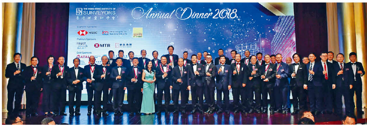
學會2018周年晚宴獲得政務司司長張建宗出席並擔任主禮嘉賓。

另一項香港測量師學會較廣為人知的工作，要數為政府擔當政策諮詢角色。「維修、樓宇安全、城市規劃等，政府都會希望我們提供意見。通過研究，學會希望為公共政策提供相關的專業意見，令其得到更有效的實施，同時亦令公眾對公共政策有更清晰的了解。雖然，學會理事都是義工，但我們希望香港可以有可持續性發展，成為宜居城市。就像最近有機構研究全球最宜居城市，香港的排名有進步空間，作為一個發展如此成熟的地區，不應該每人只有百餘呎居住空間，希望明日大嶼可以增加更多土地，令香港人的居住空間增加。」年初學會成立明日大嶼願景工作小組，並與三大會草擬計劃書給發展局。梁家棟博士測量師指報告已經完成，立場亦十分清晰。林力山博士測量師表示：「區區輪候時間愈來愈長、樓價愈來愈貴，居住空間愈來愈細，這也是多年來香港社會最關注的事。明日大嶼可以是其中一個解決辦法，市面上亦有好些其他方法，但實際上如何實施則留待政府全盤考慮，當政策通過後，我們會發表我們的專業意見，向政府建議可行、全面而詳詳的做法。」